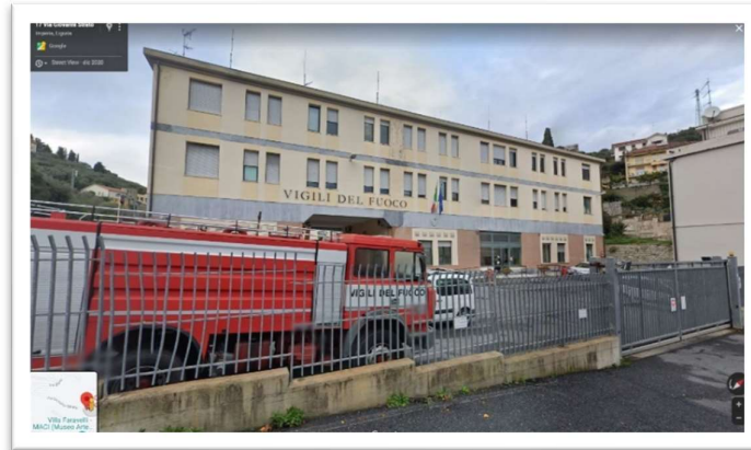
Sede Centrale – Imperia Via Giovanni Strato, 2

Le sedi operative dei Vigili del Fuoco, in provincia di Imperia sono tre: la sede Centrale di Imperia, la sede distaccata di Sanremo e la sede distaccata di Ventimiglia.