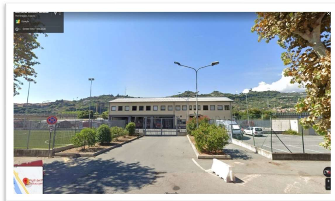
Distaccamento di Ventimiglia – Ventimiglia Corso Limone Piemonte, 7