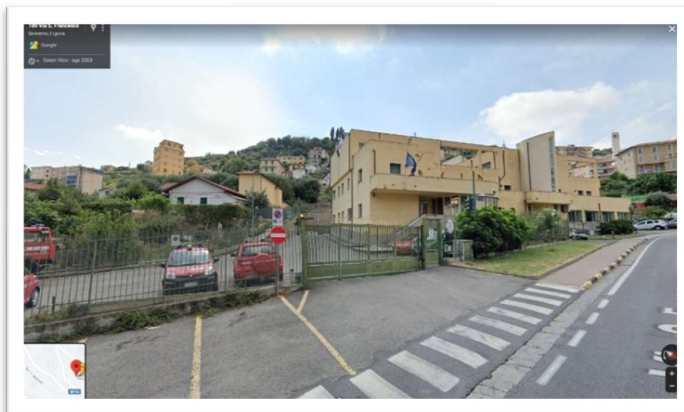
Distaccamento di Sanremo – Sanremo Via San Francesco, 333