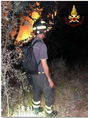
Incendio boschivo di interfaccia Verizzo-Ceriana 21-26 Agosto