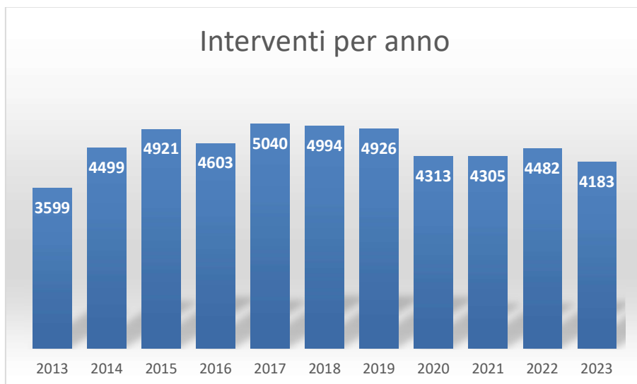
Totale interventi per anno (dati del 2023 al 30/11/23) – Comando VVF di Imperia

Si riporta di seguito il report dell'andamento degli interventi di soccorso tecnico urgente nel decennio 2013-2023: